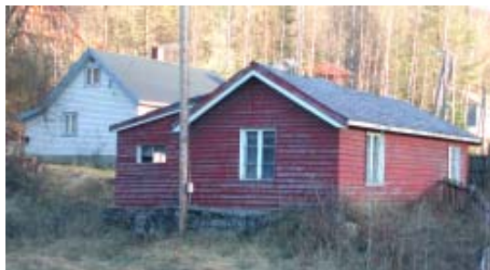
Den vesle raude stogo til Ragndi stod på Leira, sør for Valdres Bakst, heilt fram til 2005, men no er ho borte.