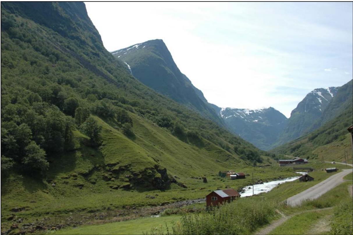
Typisk vestlandsk geitebeite i Underdalen i Sogn